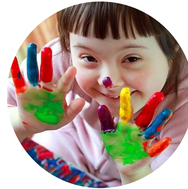
Møder Oplæg, Fagforeninger