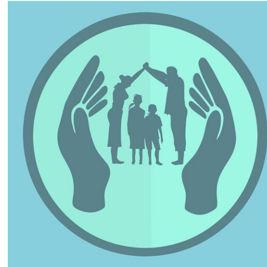
Klyngeforældreråd Brug af ny skole Netværk