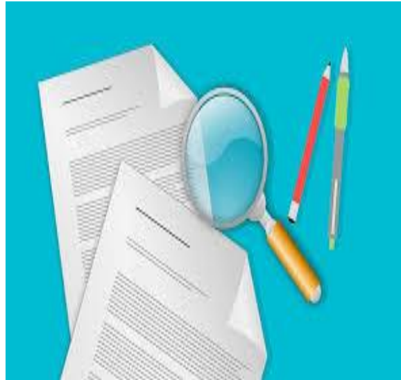
Tilsyn Hvad vil vi?